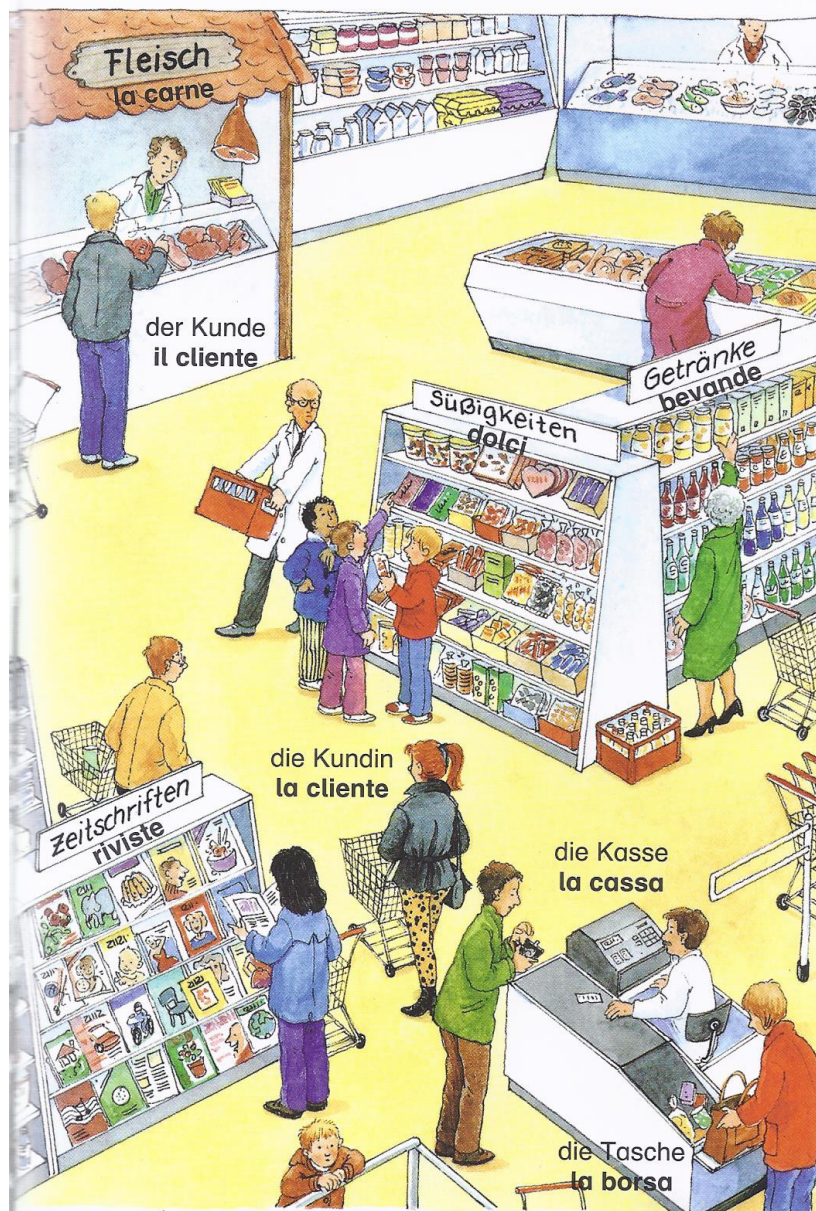
die Bonbons le caramelle